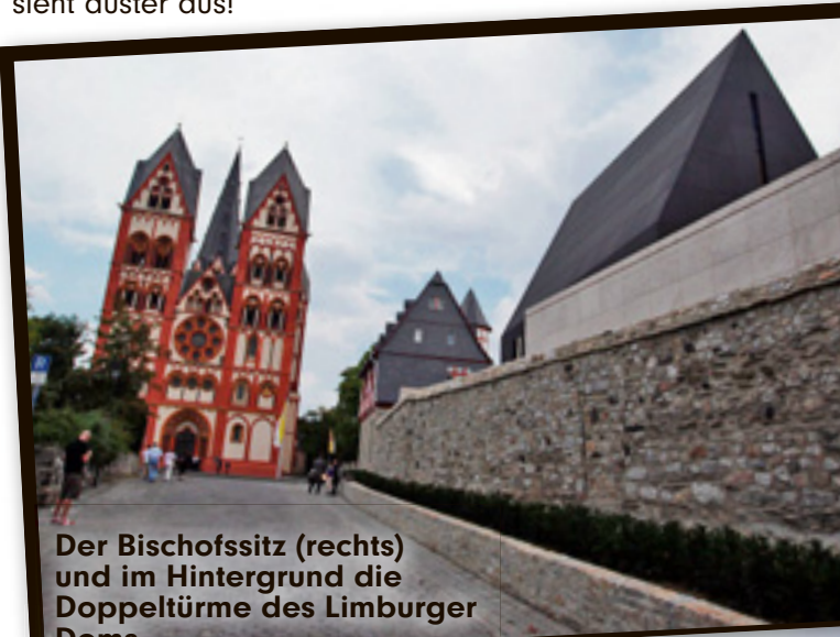
Der Bischofssitz (rechts) und im Hintergrund die Doppeltürme des Limburger Doms.

Ein Tempoverstoß, zwei Bilder: Auf der Mittelspur wurde der Passat mit 146 km/h geblitzt, auf der linken Spur nur mit 145 km/h