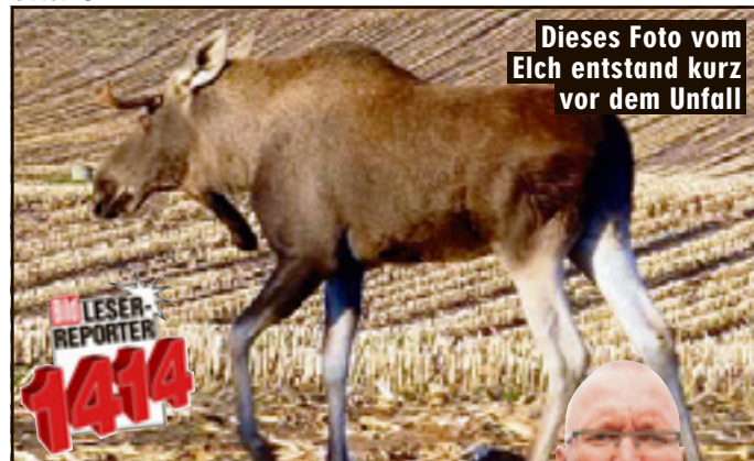
Dieses Foto vom Elch entstand kurz vor dem Unfall